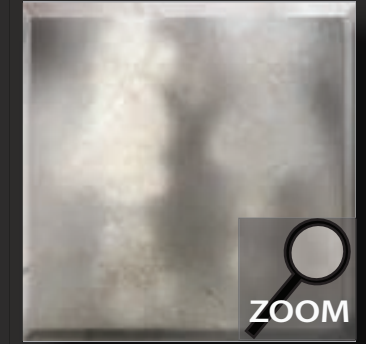
LP 2 nalewane srebro lekko oksydowane