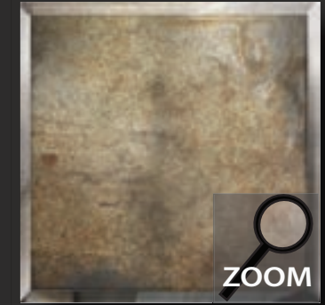
LP 4 nalewane srebro średnio oksydowane rastrowane i pokrywane płatkami metalu