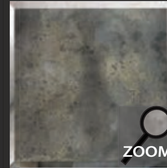
LP 3 nalewane srebro mocno oksydowane podkładach, przecierane