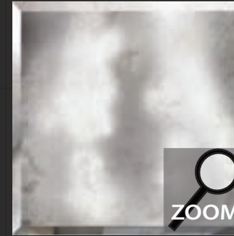
LP 1 nalewane srebro lekko oksydowane