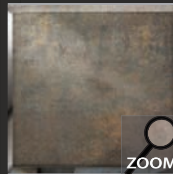
LP 5 nalewane srebro mocno oksydowane, ryсовane, pokrywane płatkami metalalu i malowane