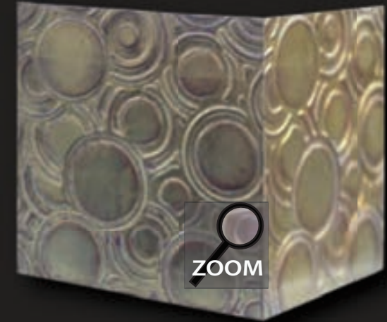
RO 3* struktura - *wykańczana płatkami oksydowanego srebra, patyny