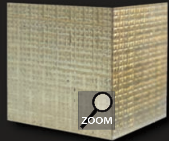
RO 6* struktura - *wykańczana płatkami złota na czerwonym pulmencie, patyny