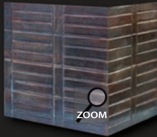
RO 2* struktura - *wykańczana płatkami mocno oksydowanego srebra, patyny